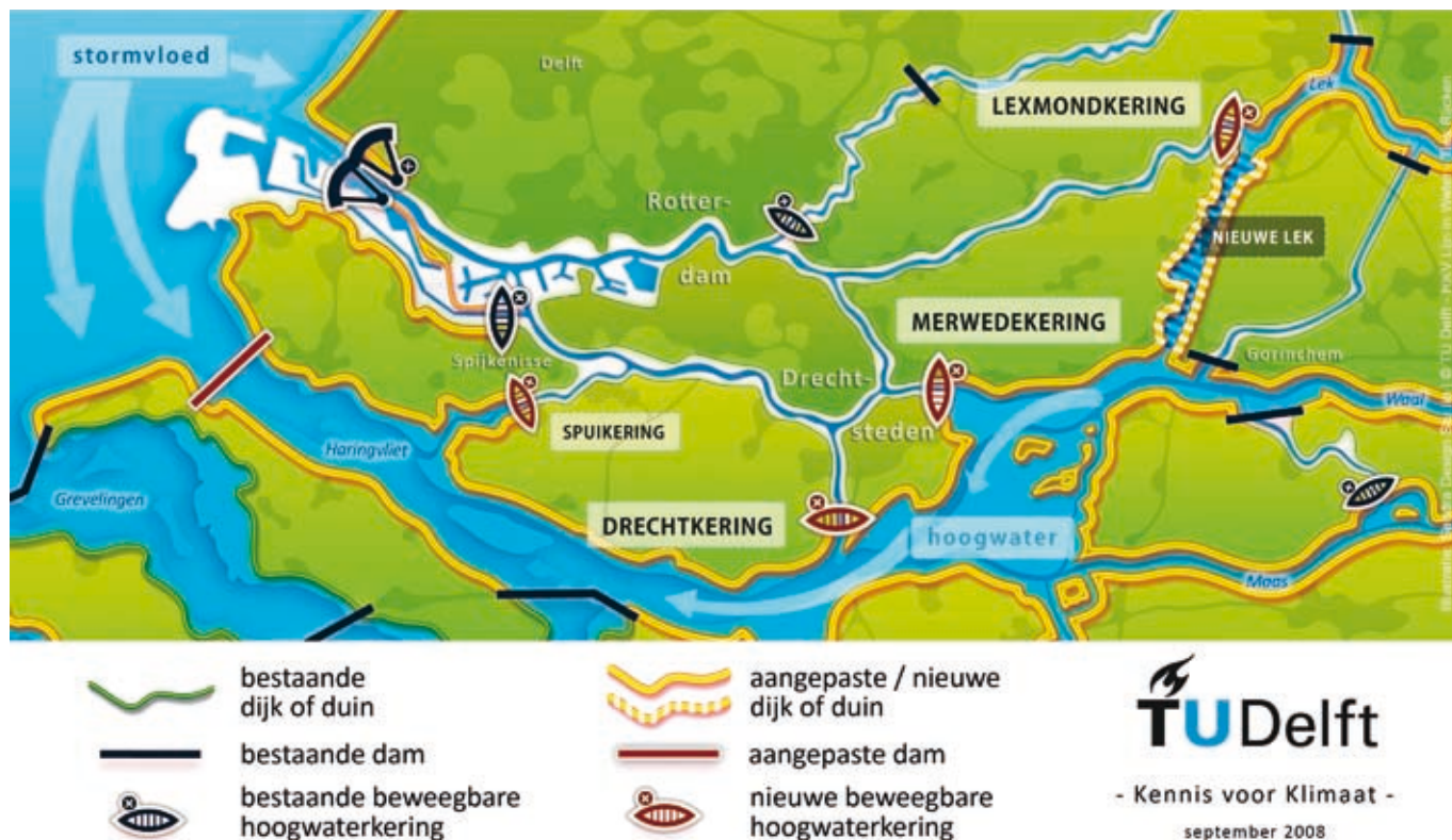
Afb. 1: 'Afsluitbaar Open Rijnmond' 10) .

Om de maatgevende afvoer van 16.000 kubieke meter per seconde van het huidige rivierverruimingsprogramma te kunnen opvangen, is voldoende noodberging, het behoud van verval en doorstroming en tenslotte meer spuicapaciteit naar zee nodig. Alleen een maximale berging zal de stijging van het water in de delta bij tijdelijk gesloten riviermonden aanzienlijk verminderen. De Deltacommissie adviseert om Volkerak-