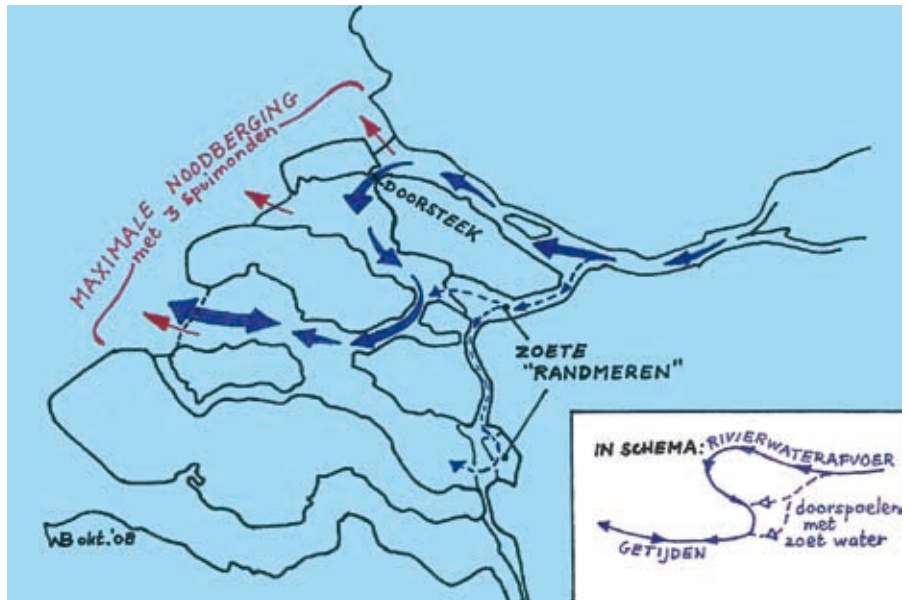
Afb. 2: Schets van het inrichtingsvoorstel voor de zuidwestelijke delta.

Het 'oorspronkelijke' estuariene karakter zal echter niet op dezelfde locaties terugkeren, omdat zowel de natuur als de inrichting van Nederland continue veranderen. Zo komt het einde in zicht van de zoetwatergetijdengebieden langs de Oude Maas en in de Sliedrechtse Biesbosch, die na de Deltawerken konden voortbestaan vanwege het restgetij via de Nieuwe Waterweg. Met de afsluiting van de Nieuwe Waterweg verdwijnen eveneens de enorme zoetwaterbellen die tweemaal daags in de Noordzee